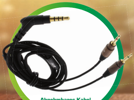
Abnehmbares Kabel Detachable cable